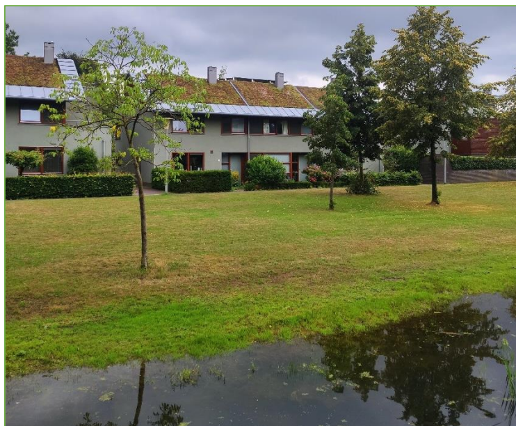
Natuurinclusief bouwen in Nieuw Monnikenhuizen, Arnhem